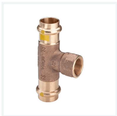
Profipress G-trójnik z SC-Contur nr wzoru 2617.2 nr kat. 352 707